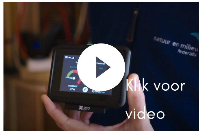
Energieloket Flevoland Op huisbezoek met energiemonitor en advies op maat