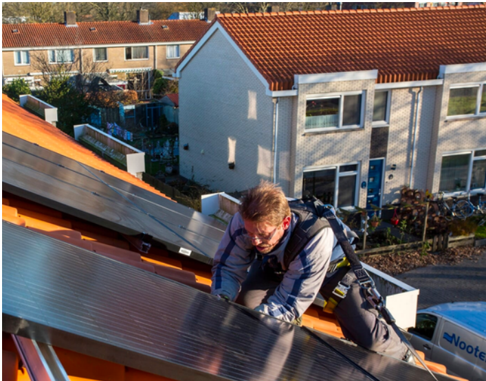
Zonnepanelen aan De Boeg in Dronten